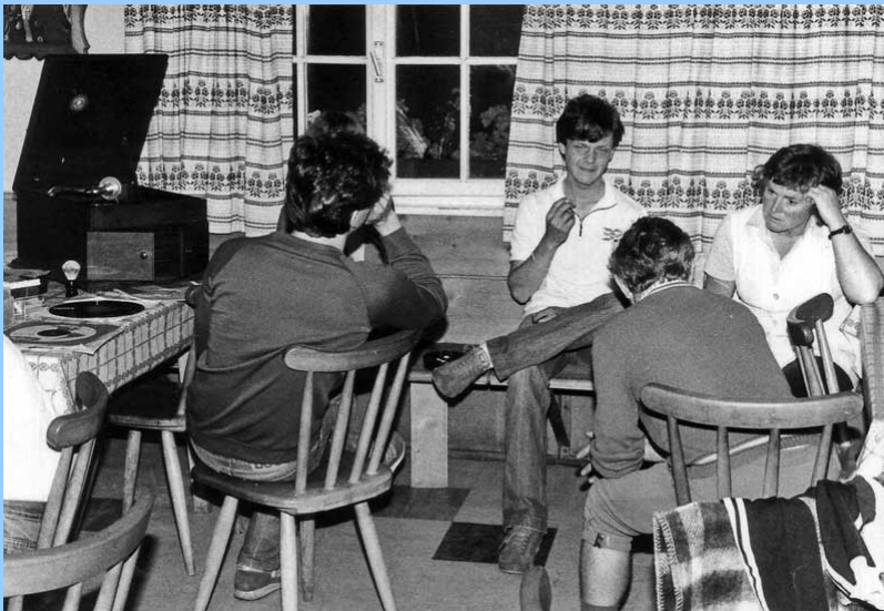
Schellack-Filmmacht auf dem Hochälpele 1981