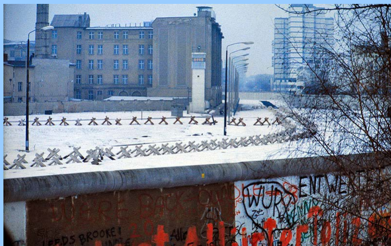
Westseite besprühte Bauwerk die "Berliner Mauer"