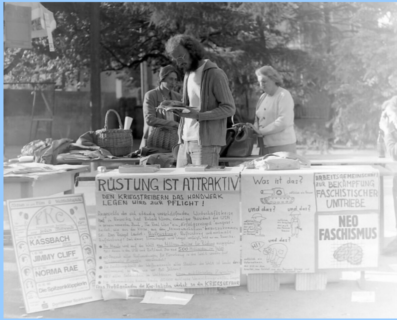
Stadtpark 1980: Im Spätsommer 1980 tritt er FKC erstmals mit Plakaten an die