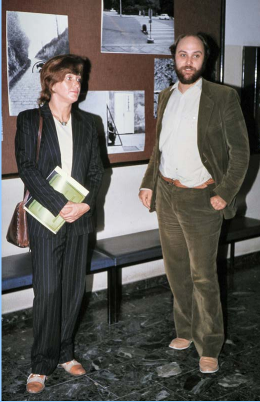
Frau Valie Export war am 20.5.81 beim FKCa