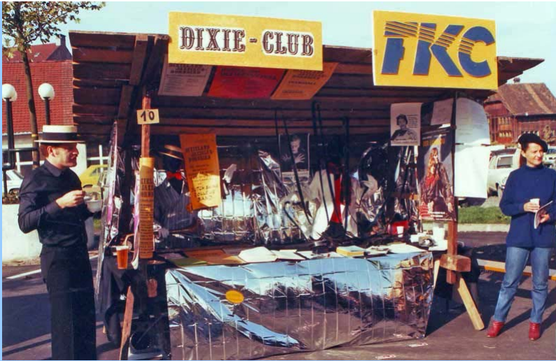
Stadtfest (Eröffnung des Kulturhauses) 1982, FKCa und Dixie-Club mit eigenem Stand