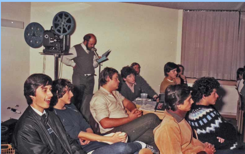
und 16mm - Kurzfilmen