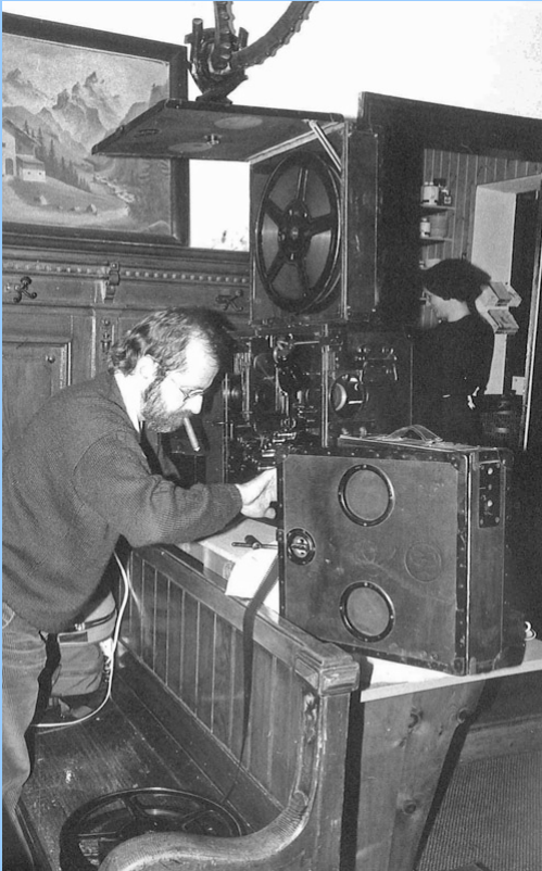
Zum 10 Jahresfest im Gütle 1990 zeigten wir den Stummfilm "Sodom und Gomorrha" mit einem historischen 35mm-Projektor