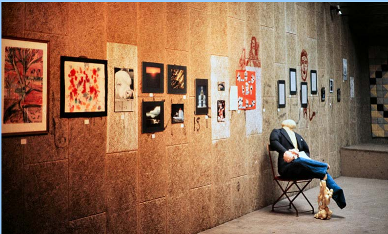
zweimal mit einem Kunstwettbewerb (1981, 1982)