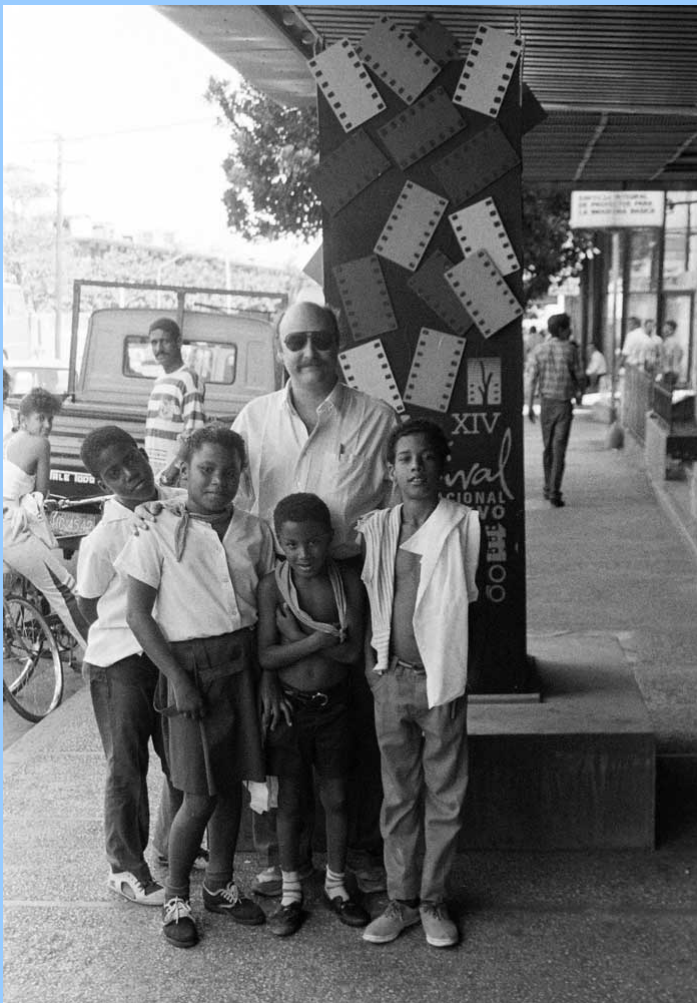
Fink besucht 1992 sogar das Festival des Neuen Lateinamerikanischen Films in Havanna