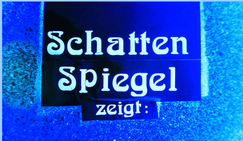
Wir machten eigene Wochenschauen