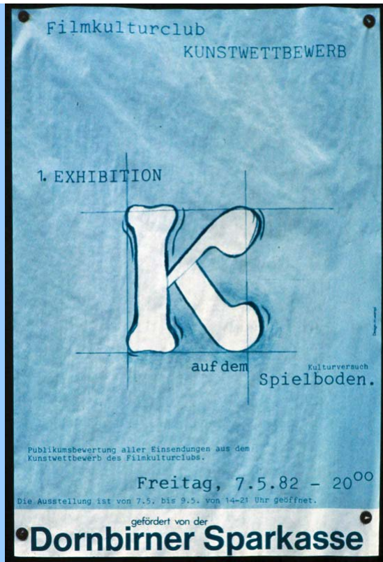
und förderten die Kreativität unserer ZuseherInnen