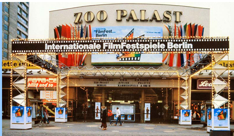
Wir besuchten die Filmfestspiele Berlin im März 1983