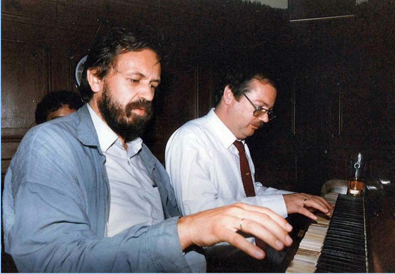
Gaul und BGM Rümmele jamten für den FKCa im Gütle beim 5-Jahresfest im Sept. 85