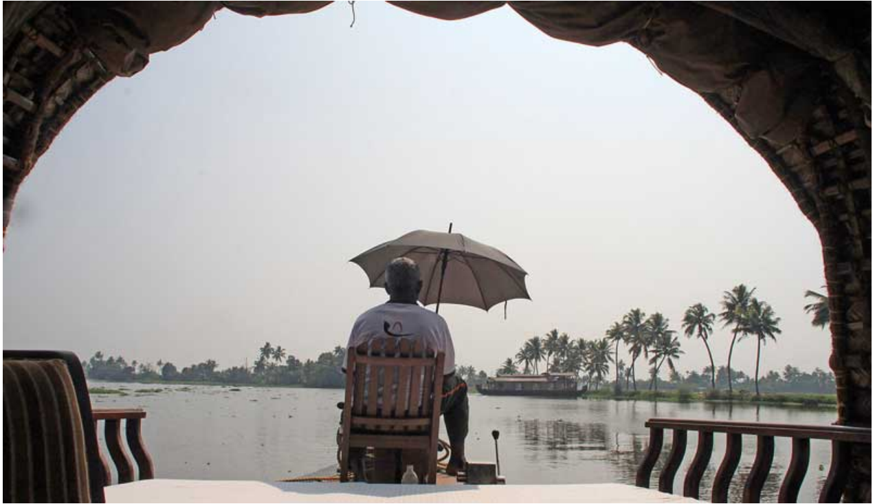
Hausboot in den Backwaters von Kerala