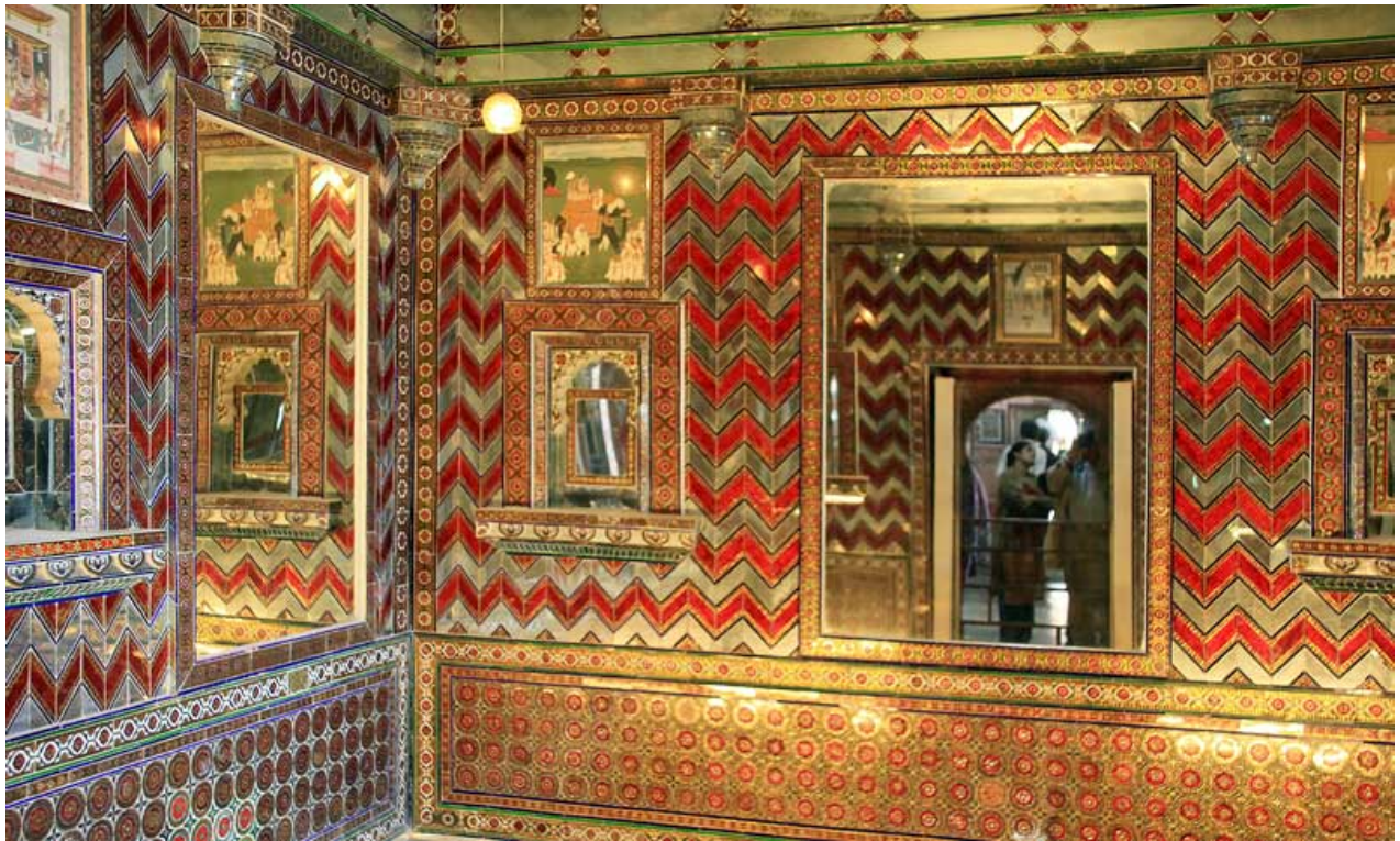
Maharajas City Palace in Udaipur

Ärgerlich war, dass unser indisches Reisebüro LPTI, immerhin jenes, das auch "Studiosus" und das eher obere Preissegment betreut, nicht im Stande war, eine Zugfahrt zu organisieren, ohne dabei parallel den Fahrer mit dem Auto mitzuschicken. Deshalb hätte eine Zugfahrt mehr gekostet als die Fahrt mit Privatlimousine und Chaffeur. Als wir eine über 8-stündige Autofahrt vermeiden wollten und mit dem Flugzeug flogen, dasselbe: man steckte uns in ein Hotel, überließ sich uns selber für 12 Stunden, während der Fahrer mit "unserem" Auto dieselbe Strecke zurücklegte. Einzig von Rajasthan bis Kerala war es dann doch zu weit: da war dann ein neuer Fahrer mit einem anderen Auto da.