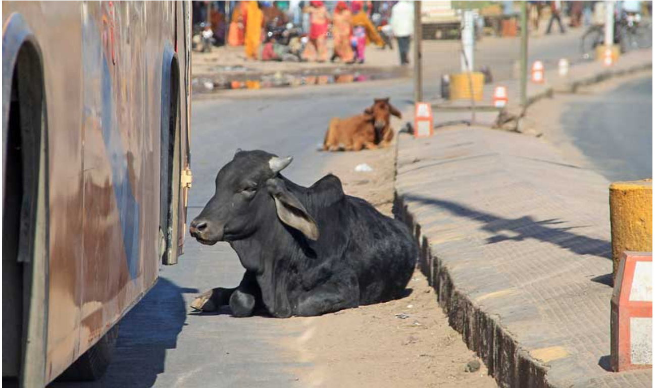
"Heilige" Kühe auf der Straße