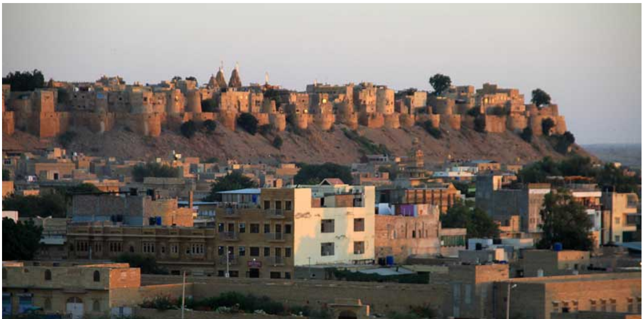
Jaisalmer, Rajastan, an der Grenze zu Pakistan