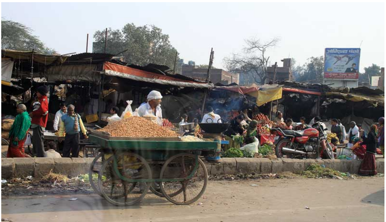
Am Straßenrand zwischen Delhi und Agra

In Südamerika beginnt das Leben oft erst so richtig in der Nacht, in Indien wird um 21 Uhr Betruhe verordnet und es gibt auch nichts zu tun. In Kuba oder Brasilien zahlt man die Musiker, dass sie länger spielen, in Indien, dass sie eine Ruhe geben.