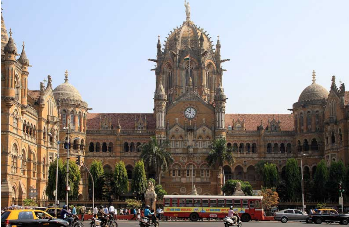
Die ehem. Victoria Station - der wohl schönste Bahnhof Indiens.

dem Flughafengebäude draußen gewesen, dass mein Chaffeur noch gar nicht da war.