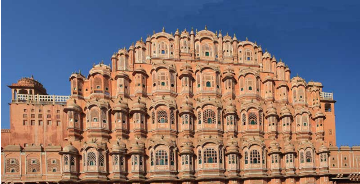
Palast der Winde

Zwar entstehen in den großen Städten derzeit überall riesige Shopping Malls mit den teuren westliche Produkten als Statussymbol, was der Inder so zum Leben braucht kauft er auf der Straße, entlang jeder Straße ist praktisch Markt.