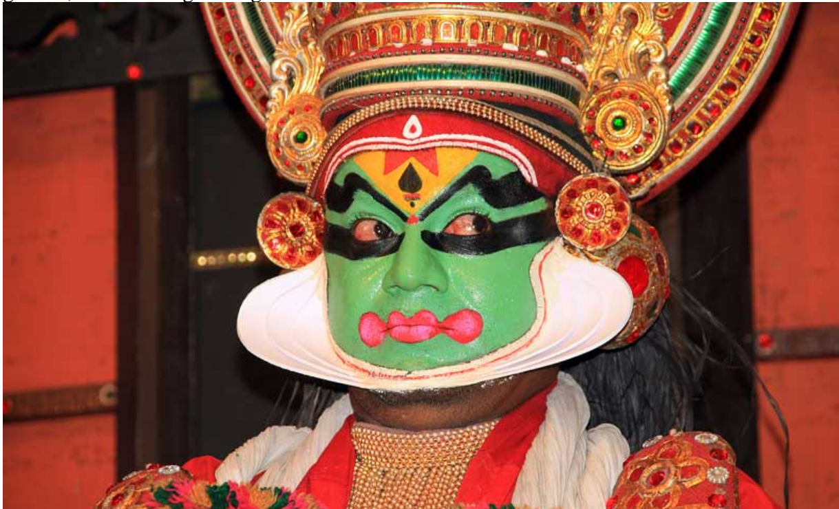
Kathami - Mimik - Theater in Kerala

Kerala , mit einer ebenfalls wahrnehmbaren christlichen Minderheit, ist ebenfalls noch kulinarisch vielseitig und relativ günstig. Hier ist alles recht ordentlich, keine Bettler, keine Slums, dank der langjährigen kommunistischen Regierungsbeteiligung. Der Verkehr relativ gesittet, fallweise sogar mit gefürchteten Radarfallen.