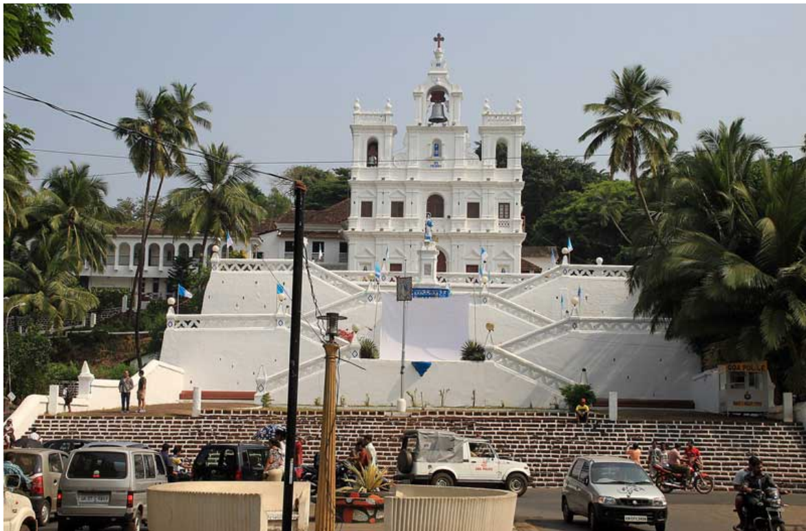
Panjim / Goa – erinnert wohl an Lamego in Portugal

Und es ist die einzige Region, wo man auch Steaks (Rindfleisch) und Schwein erhält. Und natürlich alle Arten von Meeresfrüchten, von den Langusten bis zum Red Snapper. Goa ist deshalb bei den Russen sehr beliebt. Im Süden gibt es ruhig gelegene Luxusressorts, im Norden Ramba-Zamba und Nachtclubs, inzwischen in russischer Hand. Es gibt aber keine Küstenstraße, die alles schön verbindet, sondern alles geht sehr verzweigt von sich, der billige öffentliche Bus für rund 0,20€ braucht für 20 km eine Stunde, weil er überall angehalten werden kann, die Limousinen-Taxis vor den Touristenhotels sind teuer. Günstige Tuk-tuks gibts höchstens in Panjim, der Hauptstadt. Die Kirchen in portugiesischem Stil und die Palmen erinnern sehr an den Nordosten Brasiliens. Doch dort gehen die hübschen einheimischen Mädchen in Tangas zum Baden, in Indien gehen sie mit den vollen Saris ins Wasser und lassen sich nicht ansprechen, bestenfalls fliegende HändlerInnen reden mit einem - immer dieselben paar Worte, "what is your name - where are you from?"