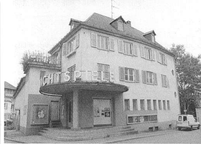
Der Kinobetrieb in den desolaten Weltlichtspielen wird mit Jahresende eingestellt