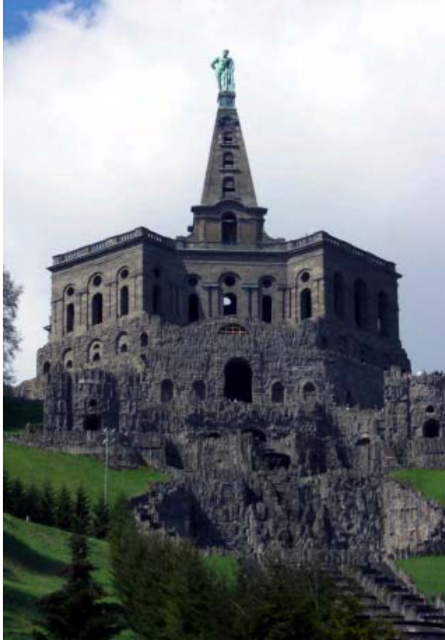
der Herkules auf der Wilhelmshöhe