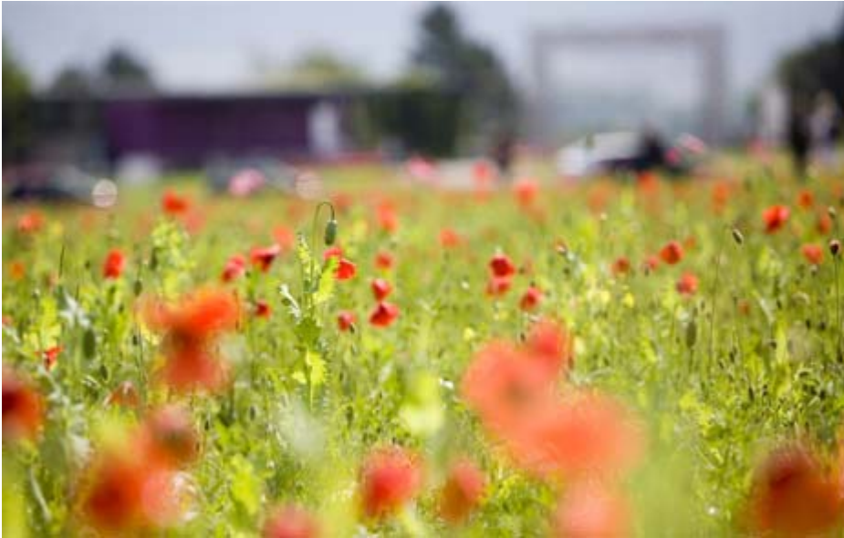
Mohnfeld am Friedrichsplatz vor dem Fridericanum

Zuerst kein Glück hatte die kroatische Künstlerin Sanja Ivekovic mit ihrem riesigen Mohnblumenfeld im Zentrum Kassels. Die Mohnblumensamen wollten einfach nicht angehen. Wochen später erblühte jedoch alles rot, was Schönheit und revolutionäre Hoffnungen symbolisieren sollte.