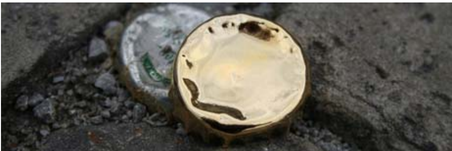
veredelter Kronkorken als Sticker

Zuerst kein Glück hatte die kroatische Künstlerin Sanja Ivekovic mit ihrem riesigen Mohnblumenfeld im Zentrum Kassels. Die Mohnblumensamen wollten einfach nicht angehen. Wochen später erblühte jedoch alles rot, was Schönheit und revolutionäre Hoffnungen symbolisieren sollte.